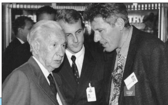
Zeigte großes Interesse am Verbund der Europäischen Akademien: IOC-Präsident Samaranch (links), hier im Gespräch mit Velens Akademieleiter Reinhardt te Uhle (rechts)

Und Europas oberster Fairneßförderer, Frits Wijk aus dem niederländischen Arnheim, drückte die Probleme in Borken mit der den Holländern typi-