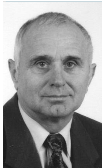
Präsident der Europäischen Sportakademie Cottbus: Dr. Hellmut Trunschke

Von Beginn an ist die Tätigkeit der Europäischen Sportakademie Cottbus e. V. (ESAC) darauf gerichtet, den europäischen Gedanken des Sports zu propagieren und dabei dem Ziel Rechnung zu tragen, daß in naher