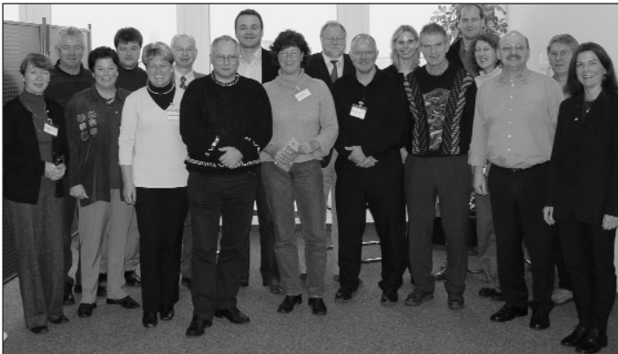
Wissen nun um die Möglichkeiten europäischer Förderprogramme und kennen die Ansprechpartner vor Ort: Teilnehmer des Workshops „Europa hautnah 04“

Dargestellt werden konnten so „europäische“ Aspekte einer Qualifizierung im Ehren- und Hauptamt, von Bildungsangeboten für verschiedene Altersgruppen und aus grenzübergreifenden Sportprojekten zwischen Schulen. Eine völlig neue