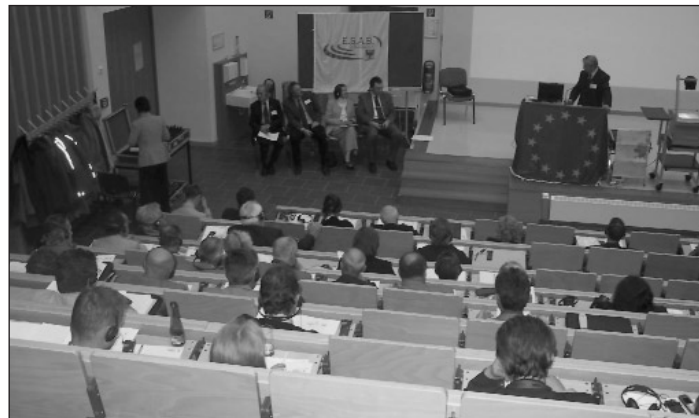
Sportstättenentwicklung: Ein wichtiges Thema in Frankfurt